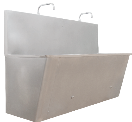
Baia de Lavagem - ST

Pode ser produzido em diferentes dimensões.