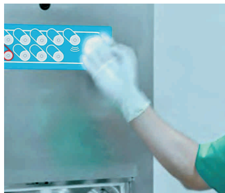
Sensor óptico en el panel.