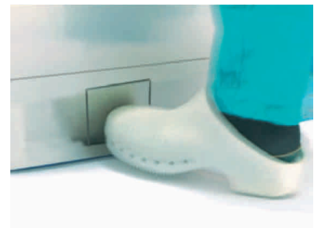
Apertura por pedal.