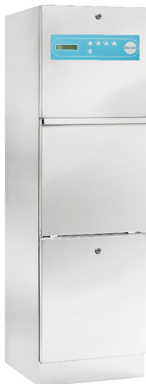
Dim. (An.xProf.xAl. mm): 450x500x1500

Pequenã cesta que permite el lavado y desinfección de los instrumentos quirúrgicos pequeños.