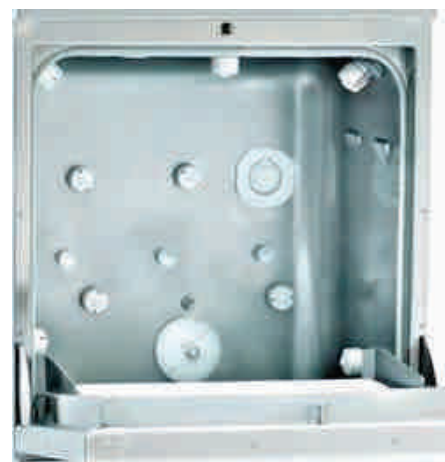
Detalle Cámara de Lavado